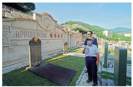
▲一般人可能一提墳場便覺得恐怖忌諱，其實墳場也承載了歷史，如香港仔華人永遠墳場便安葬了數十位近现代名人